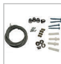
Kit de suspension 73995 (option)